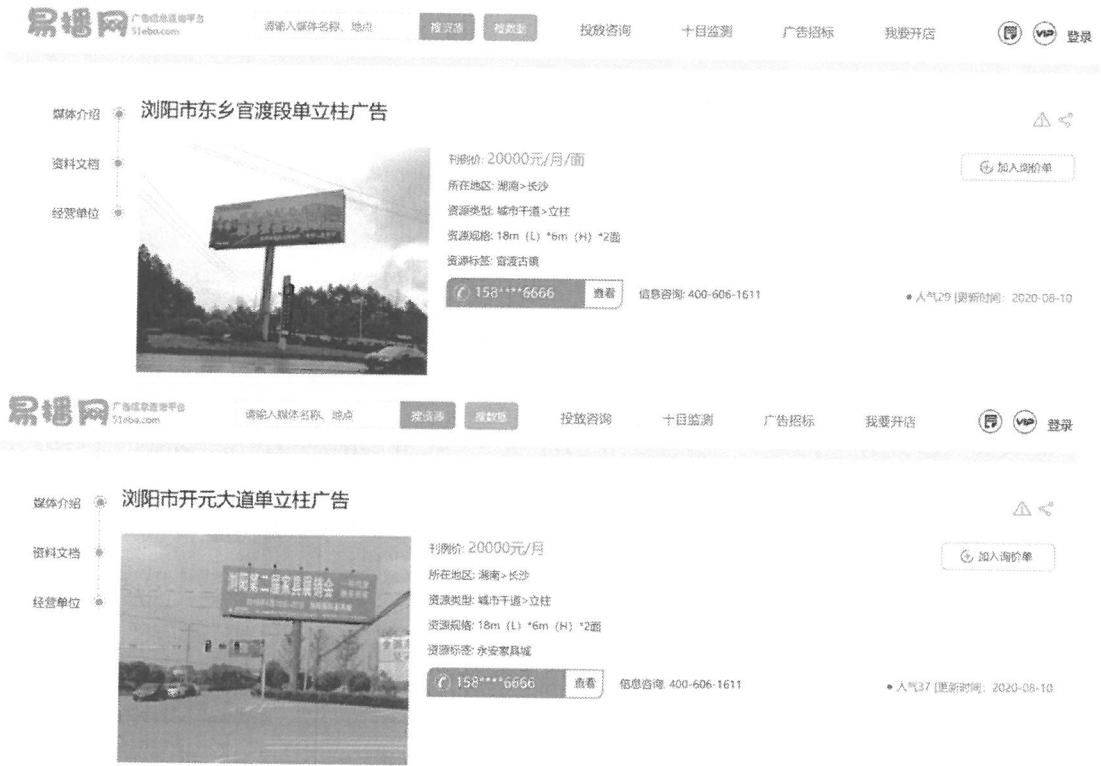
大型立柱广告牌出租价格调查表